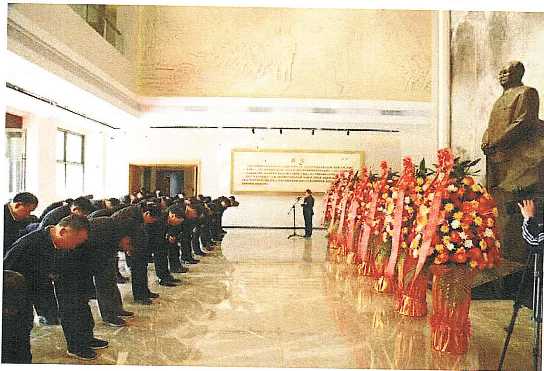
举行叶剑英同志生平事迹陈列展览开幕仪式

月 20 日成功举行“矢志共产宏图业”叶剑英同志生平事迹陈列展览开幕仪式。此次改陈布展重点围绕打造国内一流场馆的总体要求进行，通过整合建筑空间、调整展厅结构、优化参观流线进行全面升级，通过图文展板、实物陈列、雕塑创作、场景还原、多媒体展示等手法组合表现人物生平事迹，着重展示叶剑英同志在若干重要时间节点的功勋，全面准确完整地反映叶剑英同志一生的丰功伟绩，得到了各级领导和社会各界的充分肯定。展陈面积 2230 平方米，动线长度 600 米，均比原来有较大幅度增加，陈列展出 330 件（套）展品，展品数量比原展陈增加三倍。