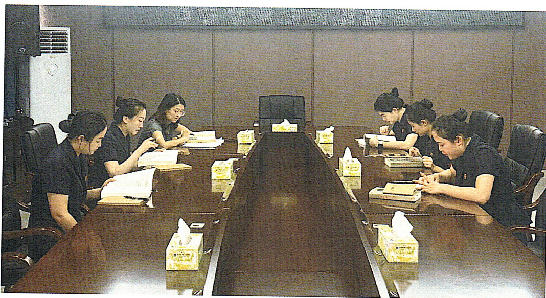
常态化开展讲解员培训

2.开展形式多样的宣教活动。面向党政机关、企事业单位等，围绕党性教育与廉政建设需求，结合叶剑英元帅革命事迹，常态化开展主题党日等教育活动，推动革命精神内化为党员干部干事创业的自觉行动。面向学校及青少年群体，紧扣爱国主义教育主线，打造“红色研学+实践体验”特色体系，常态化组织中小学开展主题研学，引导青少年厚植爱国情怀。同时主动组织红色宣讲团走进校园，结合青少年特点定制宣讲内容，运用情景讲述、互动问答等方式，让红色文化深入人心、浸润成长。