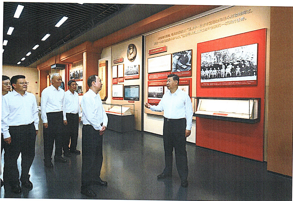
习近平总书记参观叶剑英纪念园

周密制订方案，细化组织培训和流程管理，通过全面优化讲解服务、改善园区环境、加强安全管理及设施保障等举措，有力确保了视察活动的顺利圆满完成。