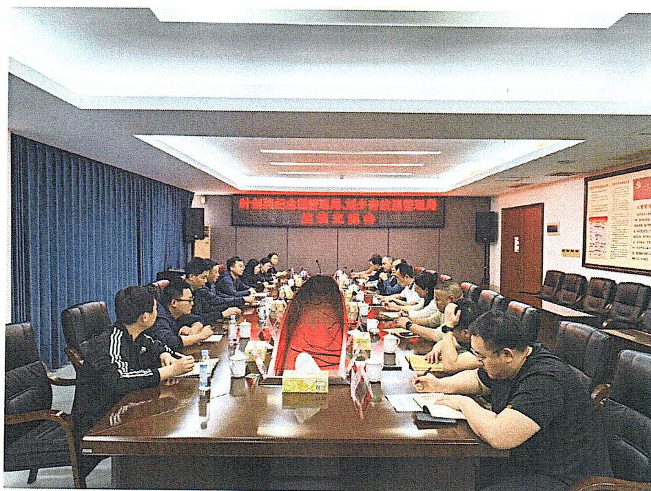
与刘少奇故居管理局座谈交流