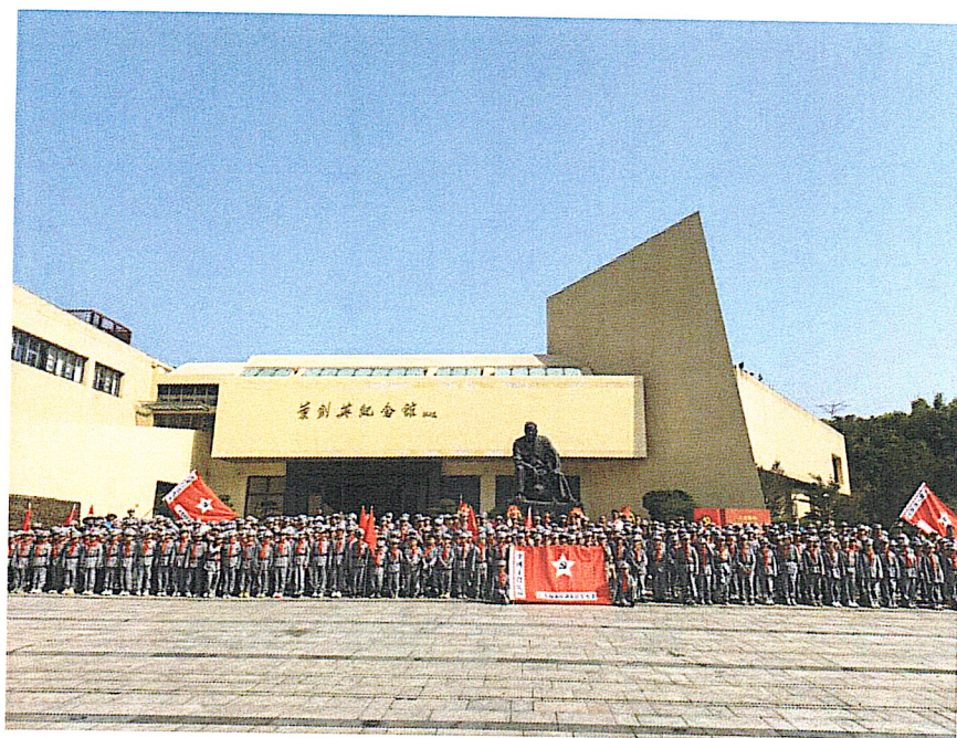
开展红色研学活动

3. 组建“小红星讲解员”队伍。“小红星讲解员”队伍的组建，是我馆深化馆校合作、推动红色文化传承的重要举措。2025年暑期，我馆与叶剑英红军小学合作，面向全校选拔21名学生，通过专业讲解授课、实景演练等方式，培养了一支“小红星讲解员”队伍。常态化安排他们在馆内参与讲解实践，不仅锻炼了表达能力，更在沉浸式学习中厚植爱国情怀，成为赓续红色血脉的生动载体。