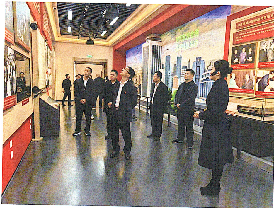
常态化开展主题党日活动